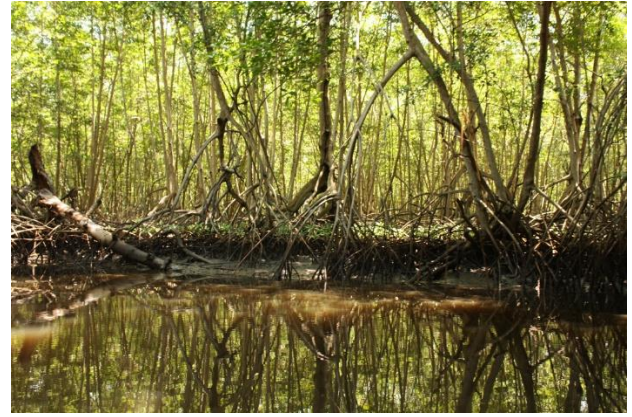
Bosque de Manglar en Barra de Santiago – El Salvador